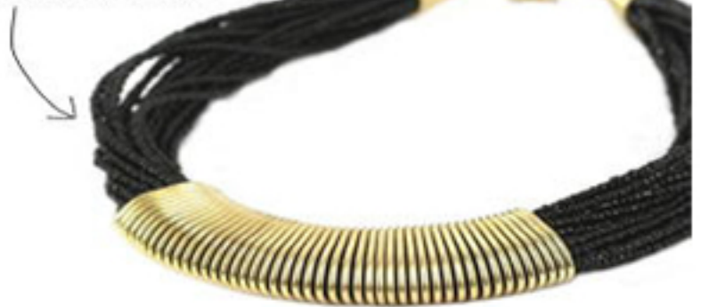
les colliers tendance