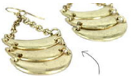
les boucles d'oreilles tendance

Si vous souhaitez en savoir plus sur ma philosophie... continuez à lire !