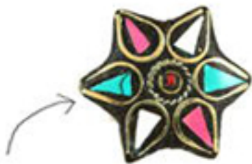
les bagues tendance