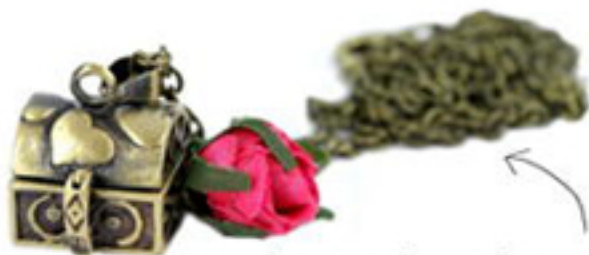
les sautoirs tendance